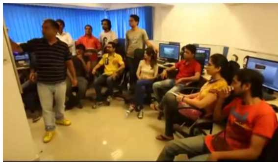
ภาพแสดงบรรยากาศการทำงานของทีมงานในละครซีรีส์เรื่องพระพุทธเจ้ามหาศตาดาวโลก