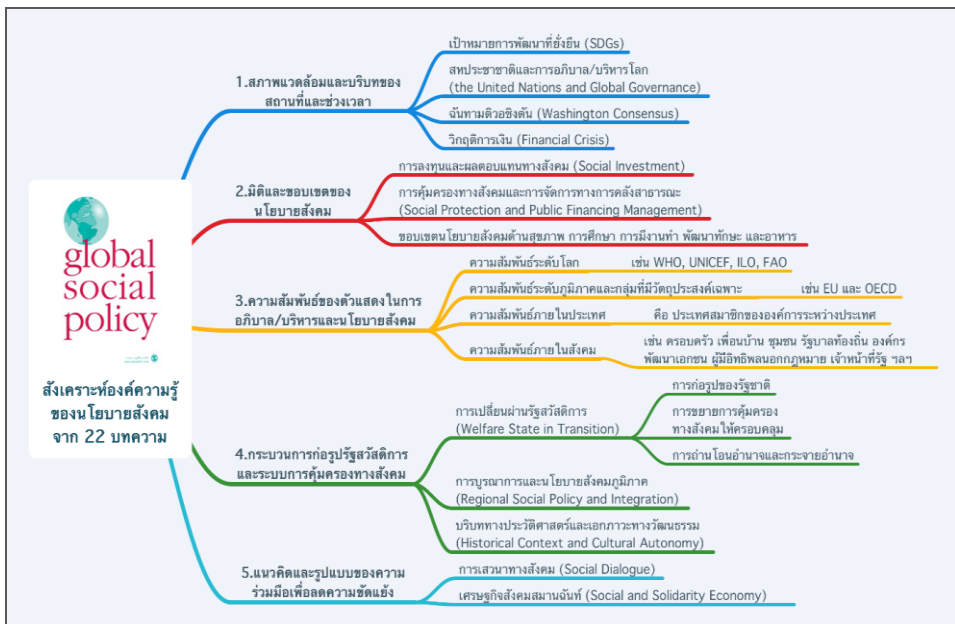
ภาพประกอบ 2 การสังเคราะห์องค์ความรู้ในนโยบายสังคมจากบทความ 22 รายการในวารสารนโยบายสังคมโลก

การสังเคราะห์องค์ความรู้จากบทความ 22 รายการในวารสารนโยบายสังคมโลก เพื่อสำรวจทิศทางนโยบายสังคม และนำไปใช้ออกแบบระบบการคุ้มครองทางสังคม เพื่อลดความขัดแย้งและขับเคลื่อนสู่สังคมสมานฉันท์โดยเน้นการมีส่วนร่วมจากทุกฝ่าย ใช้เครื่องมือและกลไกทางนโยบายสังคม ผู้เขียนจึงแบ่งประเด็นตามที่สังเคราะห์จากบทความ และยืนยันข้อมูลที่บทความนโยบายสังคมระหว่างปี ค.ศ. 2001-2020 ว่าทิศทางสอดคล้องกับบทความทั้งหมดหรือไม่ ทั้งนี้ข้อสรุปที่ได้จากการสังเคราะห์องค์ความรู้ จะไม่เฉพาะเห็นทิศทางนโยบายสังคม แต่ยังเห็นพัฒนาการองค์ความรู้ตลอดระยะเวลา 25 ปีก่อนการจัดทำวารสารนโยบายสังคมโลก ส่วนผลการสังเคราะห์มีห้าประเด็นตามภาพประกอบ 2 และอธิบายในส่วนที่ 3.2.1-3.25